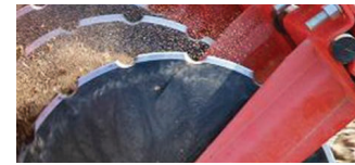
Диск на 15 дрібних зубів, компроміс між подрібненням залишків і підготовкою посівного горизонту.

Для поліпшення подрібнення ґрунту по краям було розроблено нове рішення – бічні вловлюючі щитки замість дисків. Вони легко регулюються за висотою і гарантують повне утримання землі в робочій зоні навіть при великій кількості рослинних залишків. При правильних налаштуваннях між проходами не будуть проглядатися гребені чи борозни!