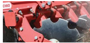
Зубчастий диск на 9 зубів (STD), підходить для подрібнення великої кількості рослинних решток.

Абсолютно безкоштовно можна вибрати між різними типами дисків: зі стандартним зубчатим профілем або дрібним зубом. За вимогою можна замовити диски діаметром від 460 до 510 мм.